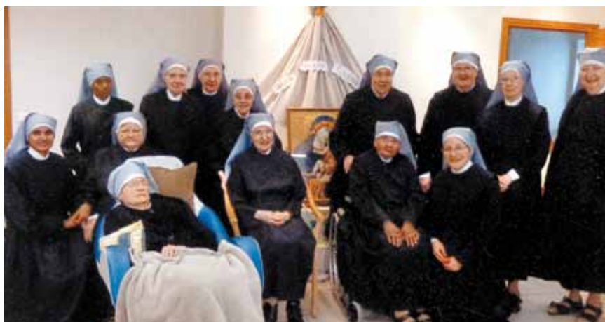
La communauté lors du passage de la mère générale, américaine, et de son assistante colombienne.

La congrégation s'adapte à chaque pays. Les communautés entretiennent un dialogue sincère pour découvrir les richesses que Dieu dispense à tous les peuples. Cette ouverture internationale, fidèle à l'Évangile, est vécue d'abord entre sœurs. L'amitié et la paix entre les peuples y gagnent. Ce devrait être à la portée de beaucoup !