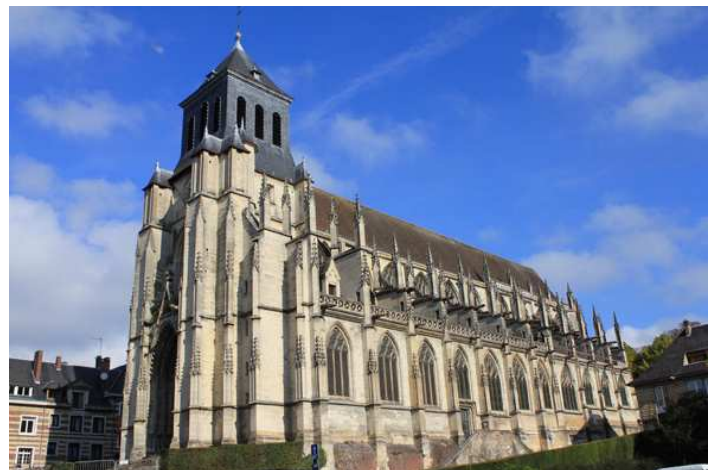
Eglise st Jacques