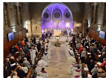
1ère assemblée à la maison diocésaine d'accueil de Merville

SERVICE DIOCÉSAIN LITURGIE ET SACREMENTS MAISON DU DIOCÈSE 174 RUE LEOPOLD DUSART