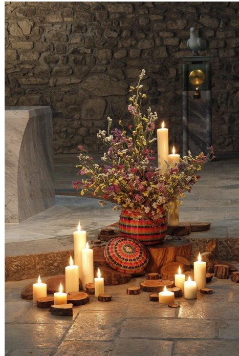
Photo : Fleurissement liturgique de Noël à l'abbaye de Tamié

CHAQUE SESSION DURE UNE JOURNÉE COMPLETE DE 9h30 à 18h30