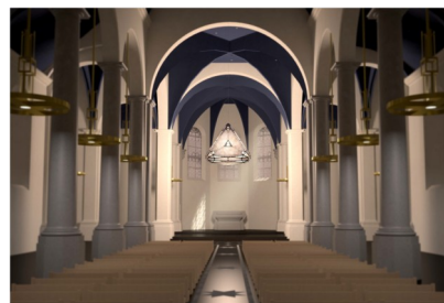
Projet en cours de réalisation