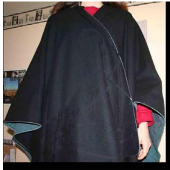
Exemple de châle – Modèle non contractuel

Combien de fois avons-nous entendu dire : « Nous ne sommes vraiment pas assez nombreux pour assurer le service » ou au contraire « Nous sommes trop nombreux, qu'allons-nous pouvoir proposer comme service aux stagiaires !!! ».