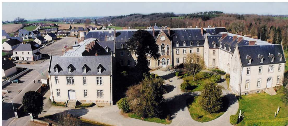
Sanctuaire de Pontmain (un jour d'affluence)