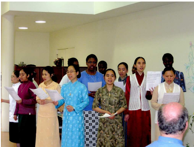
Les travailleuses missionnaires de Lisieux