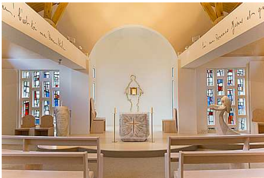
Chapelle Notre-Dame du Sourire