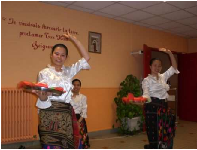
Les travailleuses missionnaires dansant lors d'une veillée