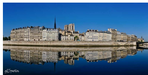
Ile de la Cité