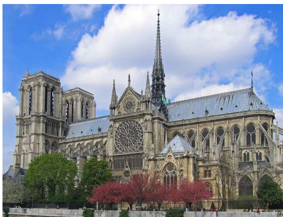
Cathédrale Notre Dame