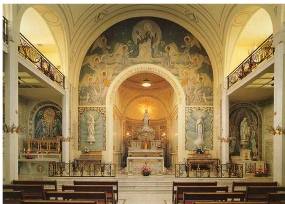
Chapelle de la Médaille Miraculeuse

A 13 heures, repas chaud à la maison des Lazaristes, puis visite du tombeau de St Vincent de Paul.