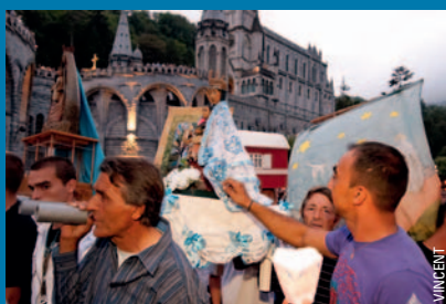
20-25 août 2012 : Avec Notre-Dame des Gitans, les gens du voyage sont venus prier à la Grotte de Lourdes en famille.