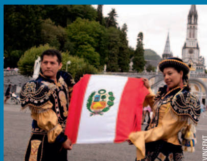
15 août 2012 : Des pèlerins péruviens à Lourdes pour la fête de l'Assomption !