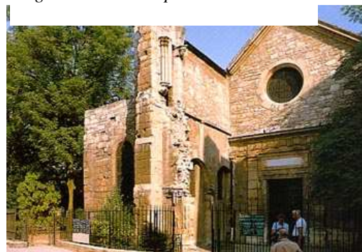
Eglise St Julien le pauvre