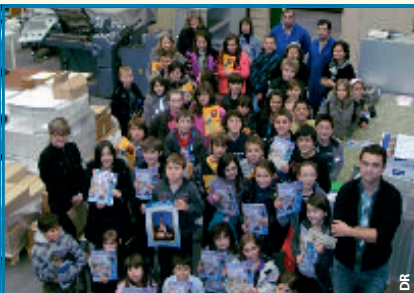
Le 15 novembre 2011, les élèves de CM2 de l'école de Soum à Lourdes ont visité l'Imprimerie de la Grotte. Ravis de leur visite, ils ont découvert le travail nécessaire à l'élaboration d'un livre.