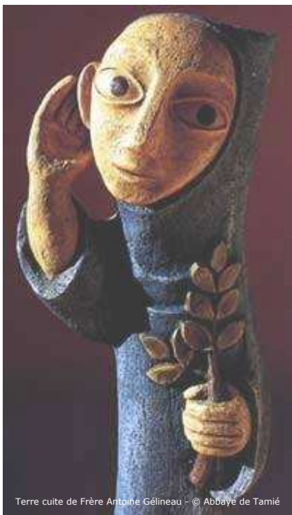
Terre cuite de Frère Antoine Gélineau - © Abbaye de Tamié

Village Jeunes Maison du Diocèse 174 Rue Léopold Dusart BP 17 59590 RAISMES Tel : 03 27 38 12 97 06 89 62 26 02 e-mail : service.aep@cathocambrai.com