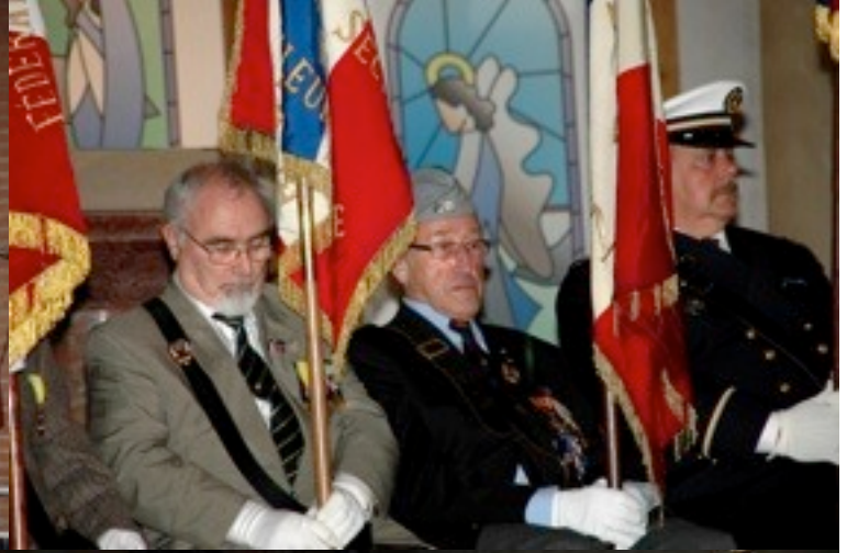
La messe du 10 novembre 2011