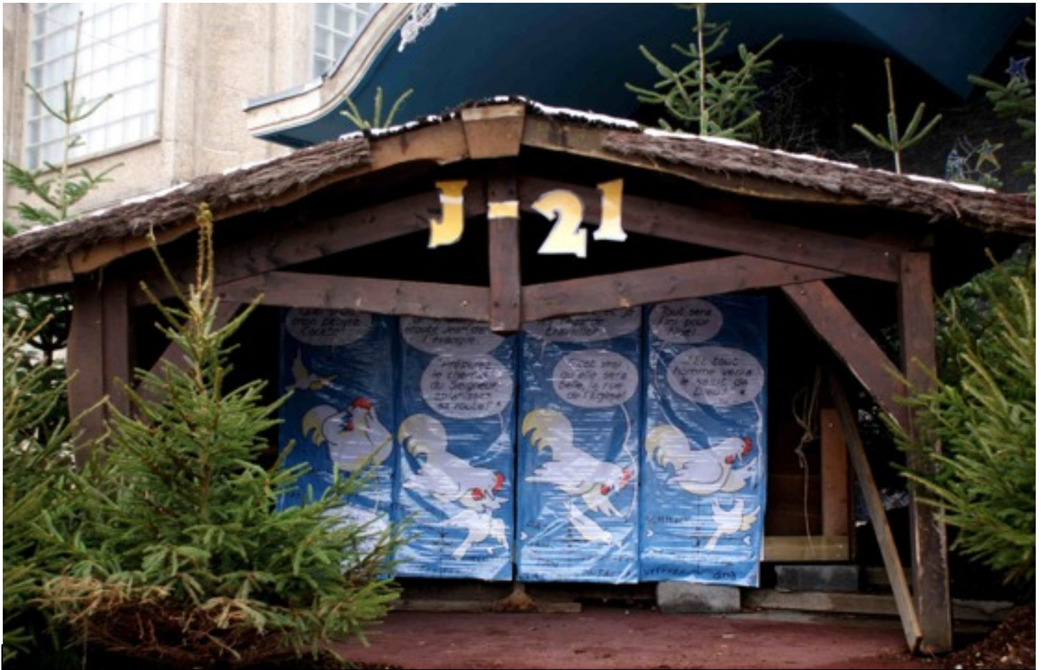
L'église Saint Pierre Saint Paul de Maubeuge aux couleurs de l'Avent