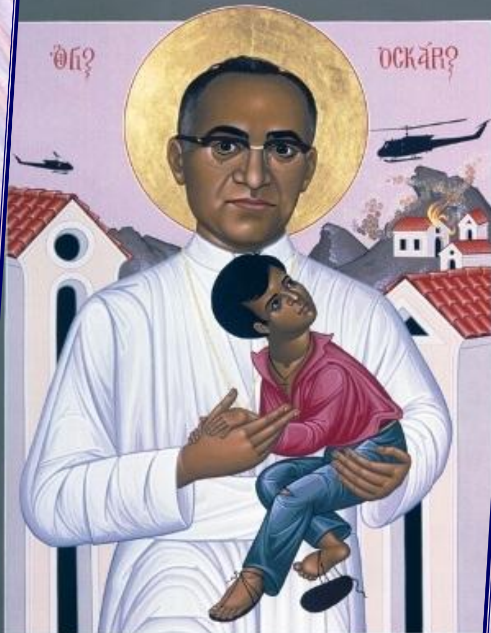
OSCAR ROMERO DE EL SALVADOR

En prononçant ces paroles, Jésus pensait au martyr. Comme tout chrétien - afin de servir le Maître et de rester fidèles à l'Évangile - nous devons être prêts à perdre notre vie, mourant même - s'il le faut - de mort violente, ce qui nous vaudra, par la grâce de Dieu, d'obtenir la vie véritable.