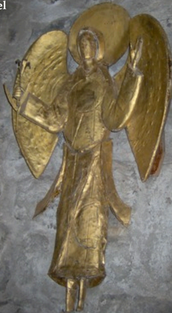
Le Puy-en-Velay Chapelle Saint Michel de l'Aiguilhe

12 h 10 Maubeuge St Pierre St Paul (5 baptêmes)