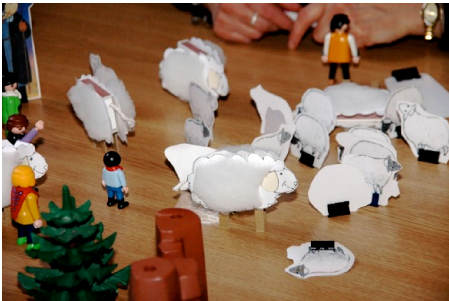
Atelier sur Jésus le bon berger, lors de Parole de Fête, la semaine dernière