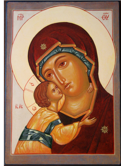
Vierge de Vladimir