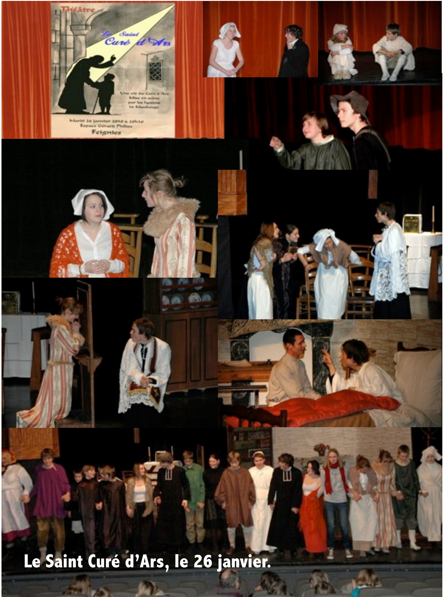
Le Saint Curé d'Ars, le 26 janvier.