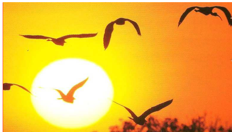
« Je suis toujours avec toi » psalme 73.