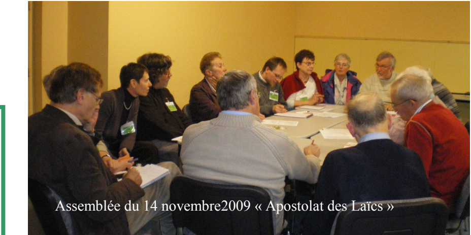
Assemblée du 14 novembre 2009 « Apostolat des Laïcs »