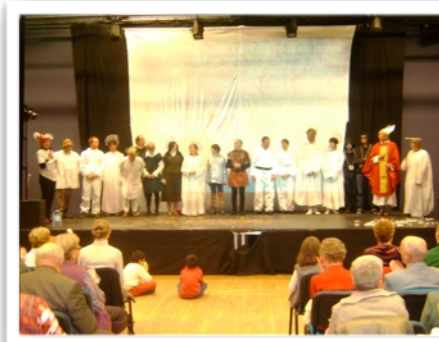
La troupe d'acteurs-amateurs