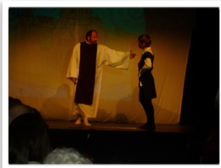
Harduin guéri et converti