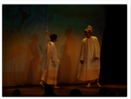
Maxellende et Druon

Une conclusion : « un chaleureux MERCI aux acteurs qui m'ont fait passer une belle après-midi ! »