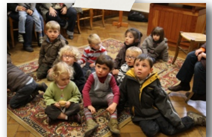
L'équipe Eveil à la Foi