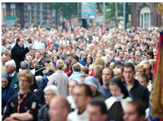
Messe du Millénaire du St Cordon : un chœur au cœur de l'assemblée

Yannick LEMAIRE ☎ 06 83 00 81 81 www.liturgie.cathocambrai.com