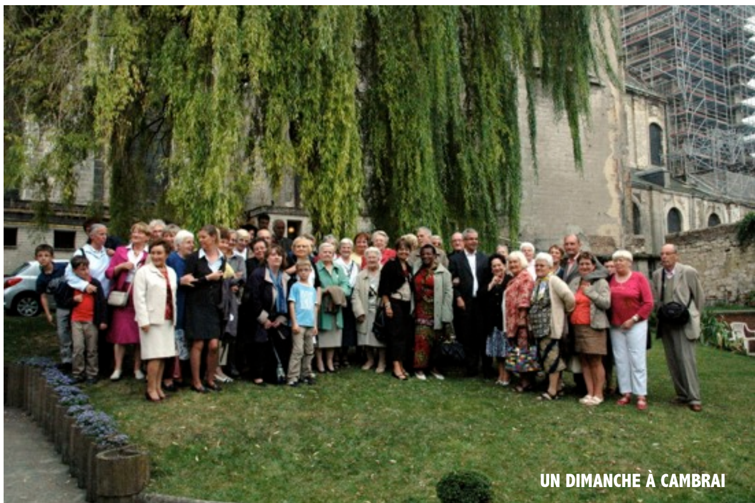
UN DIMANCHE À CAMBRAI

Le Caté, c'est reparti cette semaine. Mais, il n'est pas trop tard pour rejoindre un groupe : 03 27 64 69 18.