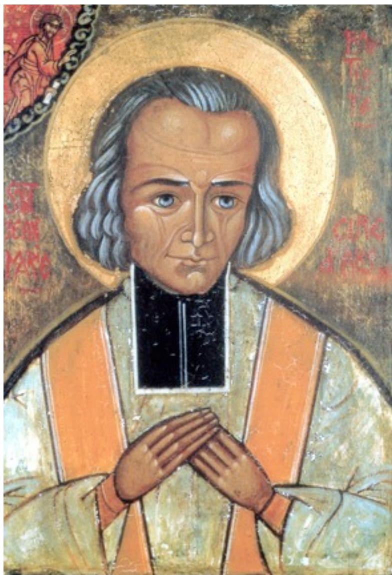
Saint Jean Marie Vianney, curé d'Ars, 1786 - 1859