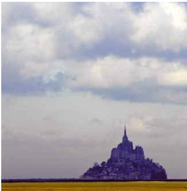
Alain Pinoges - Cric

Contact : Service pèlerinages - Maison du diocèse. E.mail : pelerinages.cambrai@nordnet.fr