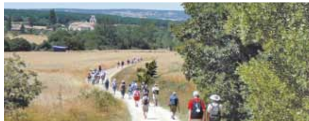
Pèlerins sur le chemin de Compostelle.

Contact : Service pèlerinages - Maison du diocèse. E.mail : pelerinages.cambrai@nordnet.fr