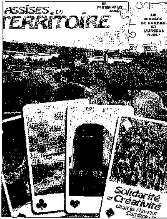
Les chrétiens, associés à d'autres acteurs, veulent valoriser les atouts du territoire. Premier d'entre eux, l'imagination.