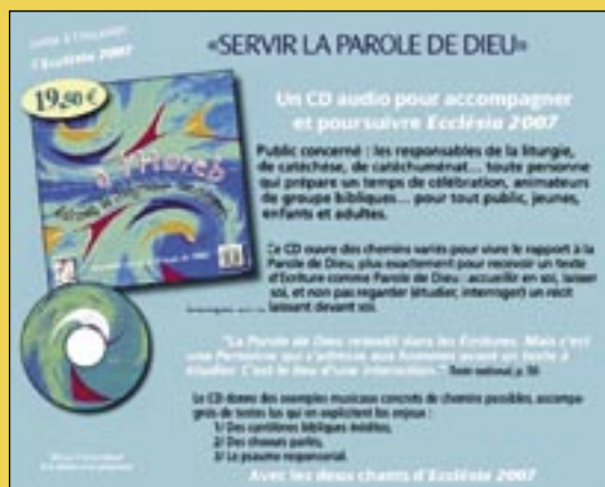
Les chants du congrès mis en vente à 19,50 euros