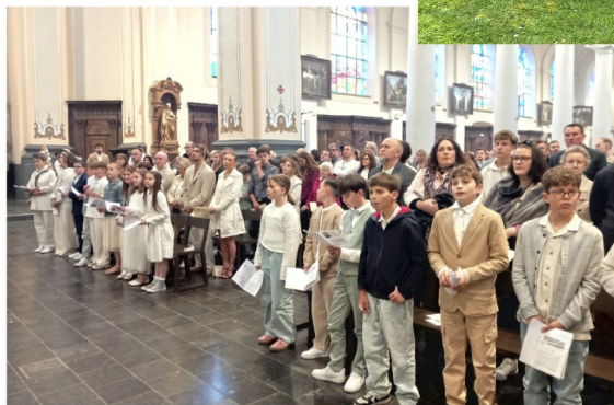
Ste Odile et St Amand