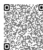
Voici mon cœur - Glorious