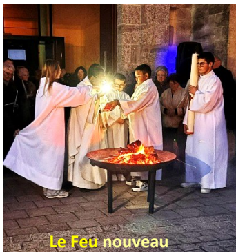
Le Feu nouveau