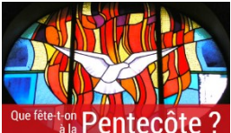
Que fête-t-on à la Pentecôte ?

L'événement de la Pentecôte ne peut être compris qu'en lien avec Pâques et l'Ascension. Jésus est mort pour le salut du monde (le Vendredi Saint ), ressuscité (le jour de Pâques ) et parti rejoindre le Père (à l' Ascension ). À la Pentecôte, Dieu le Père envoie aux hommes l'Esprit de son Fils. Cette fête clôt le temps pascal, qui dure sept semaines, et dont elle est le couronnement.