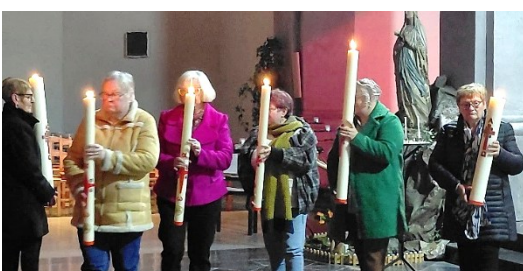
Lumière du Christ emportée vers nos différentes communautés