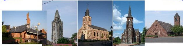
Abscon Escudain Lourches Neuville Roelx