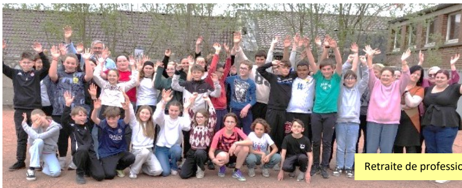
Retraite de profession de Foi à Neuville