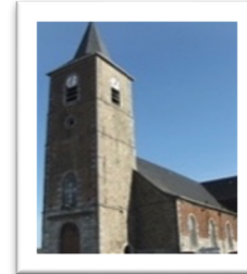
NOTRE DAME d'AYDE