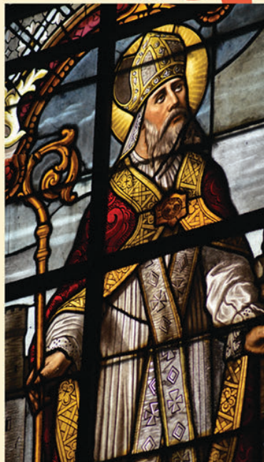
SAINTE MAXELLENDÉ ( Caudry) et SAINT GERY ( Inchy)