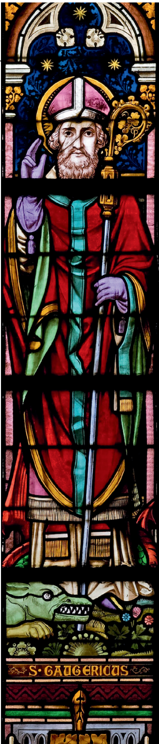
Eglise Saint-Géry de Braine-le-Comte - Détail du vitrail de saint Géry de Cambrai, sainte Waudru de Mons et sainte Aye Entre 1891 et 1900 d'un peintre verrier inconnu — KIK-IRPA - Bruxelles - 10156214