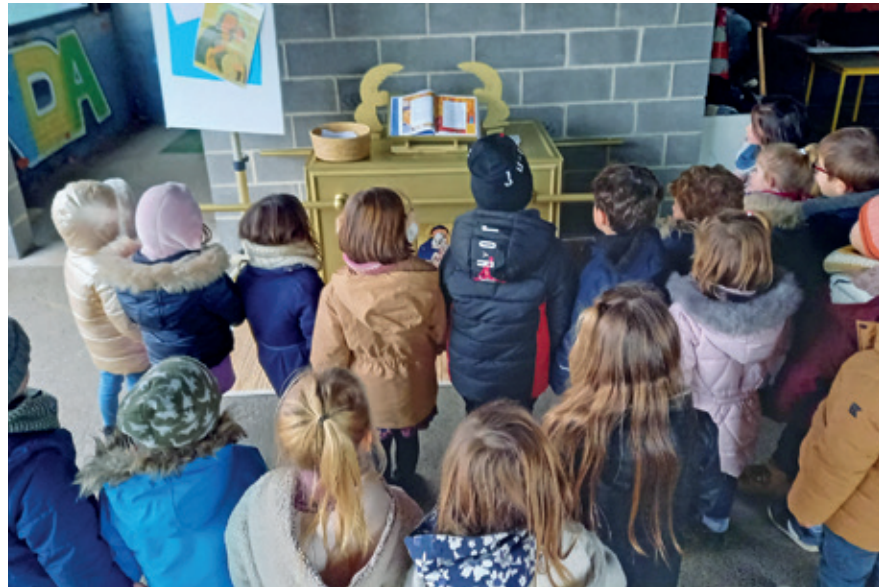
À l'école Notre-Dame-des-Anges de Saint-Amand-les-Eaux, l'arche a intrigué les enfants.