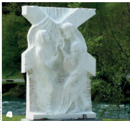
ANNIE DRAMMEH 4