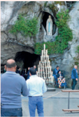
À Lourdes, chacun peut se recueillir et s'adresser à Marie.