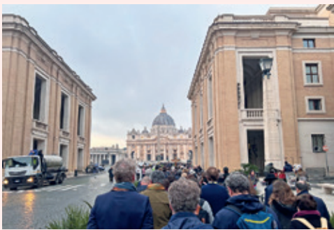
Des pèlerins cheminent vers la basilique Saint-Pierre et sa porte sainte.

« Se mettre en marche est caractéristique de celui qui va à la recherche du sens de la vie... Les pèlerins de l'espérance ne manqueront pas d'emprunter des chemins anciens et modernes pour vivre intensément l'expérience jubilaire » (pape François, le 9 mai 2024).