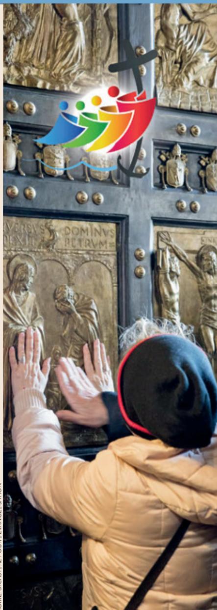
ROME, DICASTÈRE POUR L'ÉVANGÉLISATION