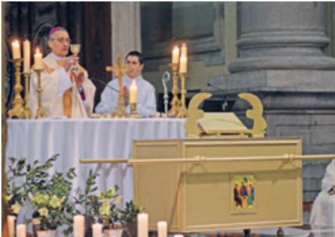
À la cathédrale de Cambrai, lors de l'ouverture de l'année jubilaire.