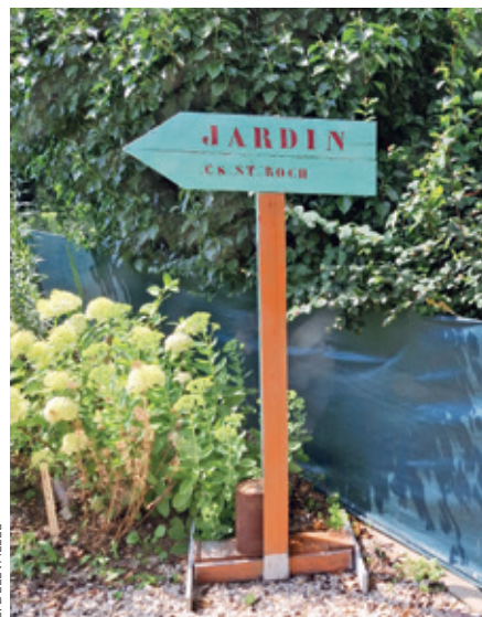
Jardin de l'église Saint-Roch.