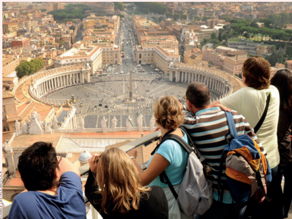
Des touristes contemplent le Vatican, du haut du dôme de la basilique Saint-Pierre.