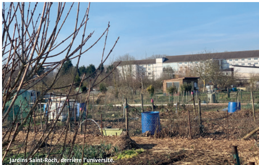
Jardins Saint-Roch, derrière l'université.

À l'ombre de l'église Saint-Roch, un espace autrefois en friche de 400 mètres carrés s'est transformé en un lieu de vie grâce à une convention entre la paroisse et le centre social. Ce jardin accueille adultes et enfants pour des moments de découverte autour de la nature.