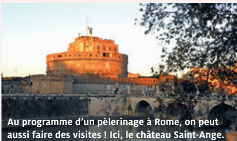
Au programme d'un pèlerinage à Rome, on peut aussi faire des visites ! Ici, le château Saint-Ange.