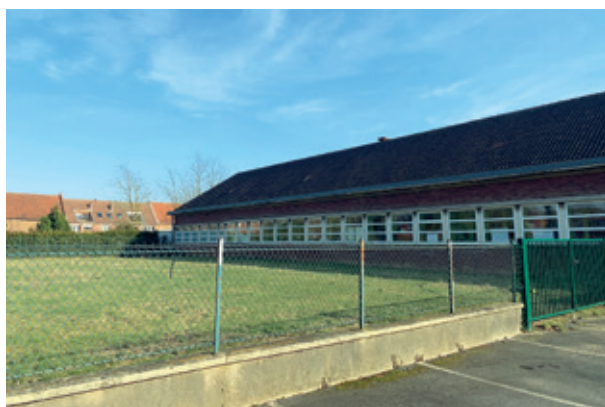
Le terrain derrière l'école maternelle Raymond-Gernez.

Cette nouvelle structure comportera un espace pour la petite enfance, l'enfance jeunesse, un autre pour les activités