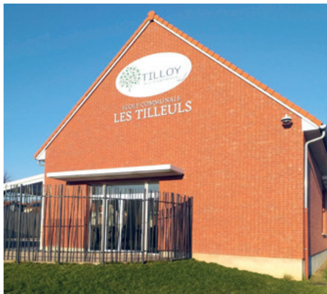
École « Les Tilleuls ».

Après une année de travaux, l'école baptisée « Les Tilleuls » a été inaugurée le 12 décembre 2023. L'effectif est désor-