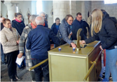
C'est avec joie que l'on vient chercher la Parole (ici à Villers-Outréaux).