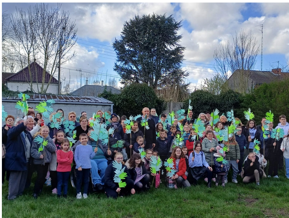
Rameaux 2024 à Escautpont

Marie, dans son cœur, n'a cessé de se laisser inviter à la paix, et à y répondre. Marie nous apprend que la recherche de la paix et du bonheur est un travail de tous les instants. Chaque pas, chaque geste, chaque prière compte. Comme Marie, tenons-nous auprès de Jésus ressuscité : Il nous invite à être pèlerin d'espérance pour bâtir ensemble un monde de bonheur et de paix.