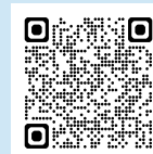
Témoignage de Sœur Stella