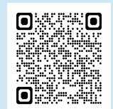
La révolution fraternelle