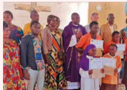
Les enfants et leurs parents préparent Noël.