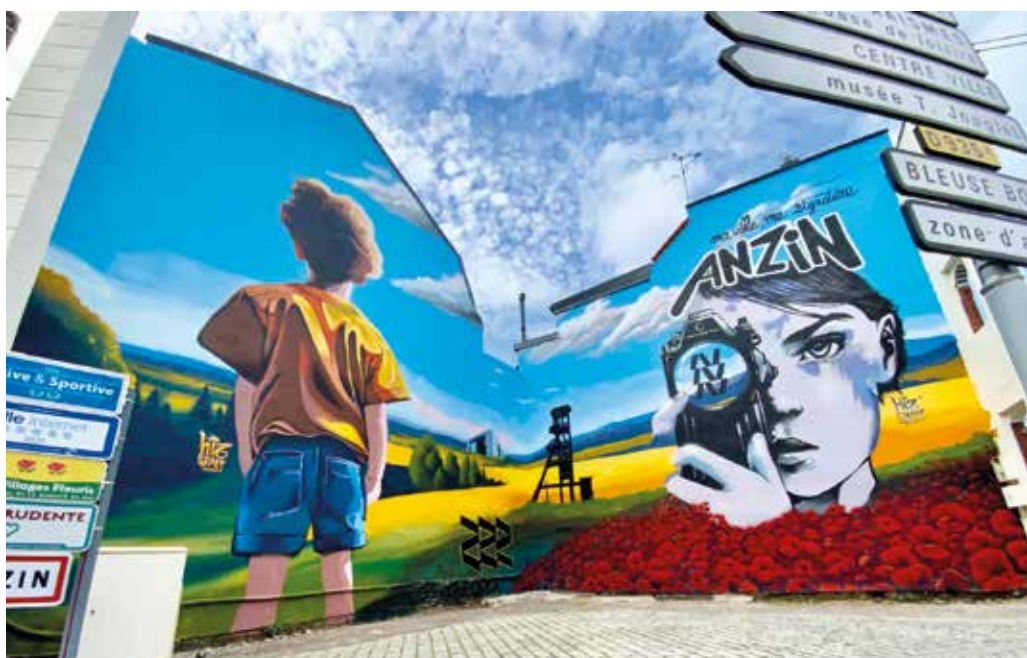
Le street art de la Croix d'Anzin.