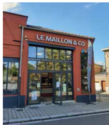
Magasin ouvert les mardi, jeudi et vendredi de 13 h à 19 h et les mercredi et samedi de 10 h à 19 h.

« En 2019, j'ai intégré l'association dans le cadre du programme d'insertion, prenant le poste d'agent polyvalent à la ressourcerie d'Anzin. Grâce au soutien du Maillon C2RI, j'ai obtenu un diplôme d'encadrante technique en 2022. Peu après, j'ai été recrutée en CDI en tant que responsable du centre de tri et, dans quelques semaines, je prendrai la responsabilité du nouveau magasin de Landrecies. »