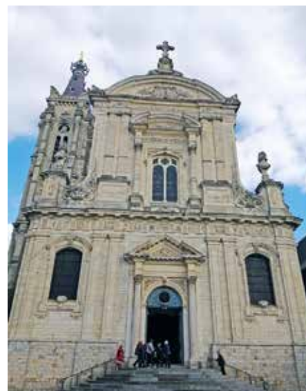
La façade de la cathédrale Notre-Dame-de-Grâce de Cambrai.