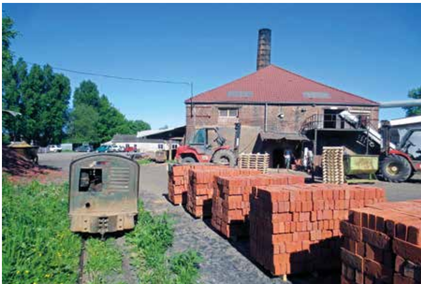
La briqueterie Chimot au temps de sa production, au fond le four Hoffmann.