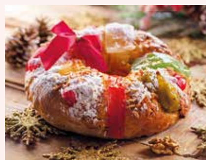
Le « bolo rei », et le plat de morue de Noël, avec pommes de terre et chou.