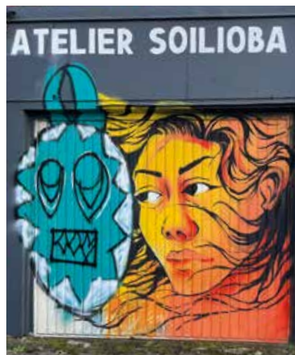
Dans son atelier, Soilio donne des cours de peinture.

Le masque est outil de liberté ou outil d'enfermement