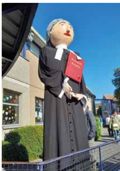
Un géant à l'effigie de saint Jean-Baptiste de La Salle accueillait les visiteurs.

en cet établissement les plus petits et les jeunes ados tels qu'ils sont. La présence d'élèves musulmans peut être source de questionnement, cela exige de nous qu'on se parle, s'écoute, apprenne à se connaître, se respecter.»