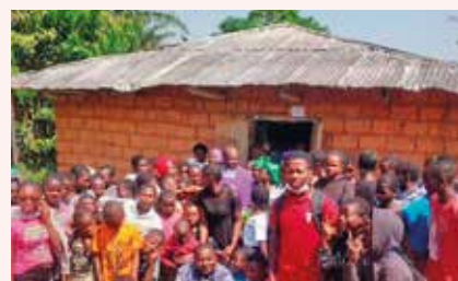
La sortie de l'église.