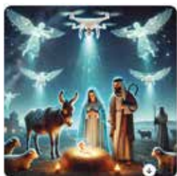
La crèche vue par une intelligence artificielle.