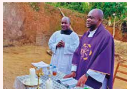
Le père Rostand célèbre dans un village.