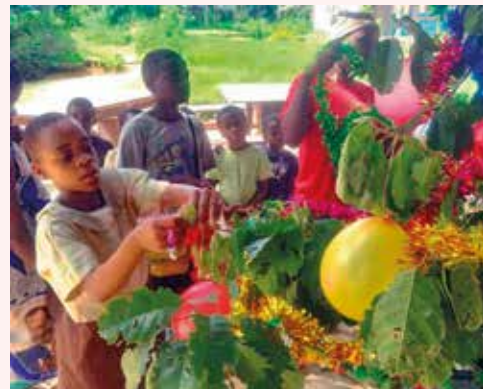
Le bananier décoré.