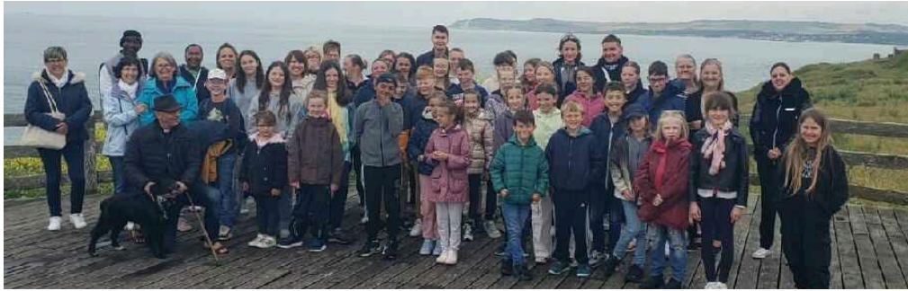
SORTIE 3 JUILLET CATÉCHISME À BOULOGNE SUR MER