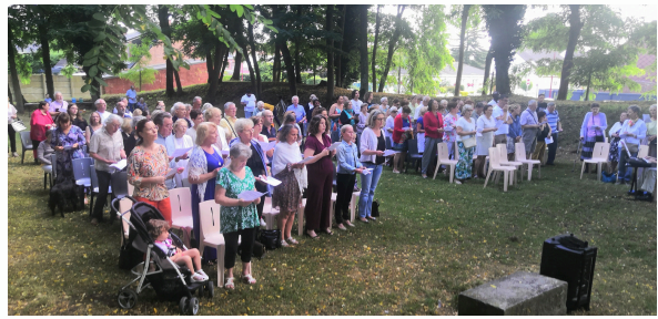
MESSE 15 AOÛT MONT DE LA PAIX AUBERCHICOURT