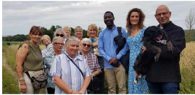
SORTIE 25 JUILLET DE L'ÉQUIPE "TECHNICIENNES DE SURFACES"