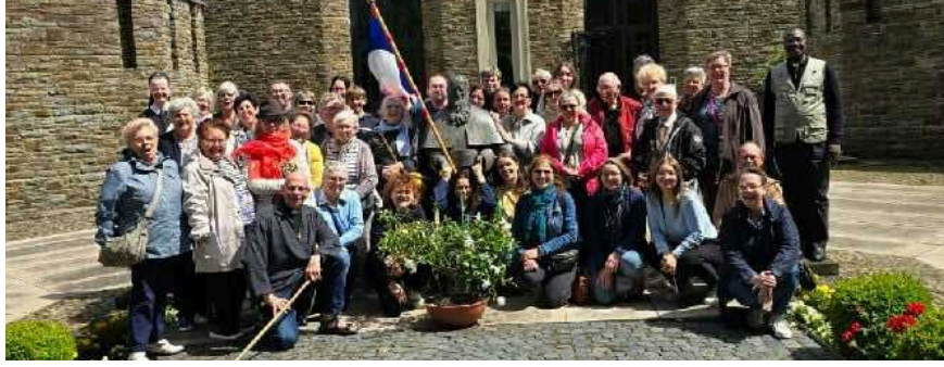
VOYAGE 15 JUIN À SCHOENSTATT