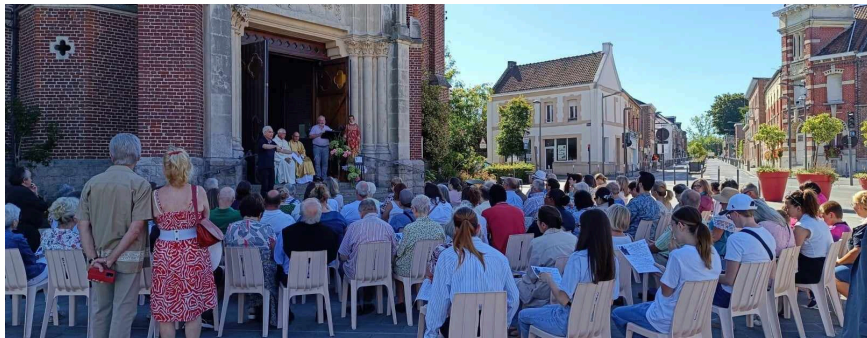
MESSE EN PLEIN AIR 11 AOÛT FÊTE DE LA ST LAURENT