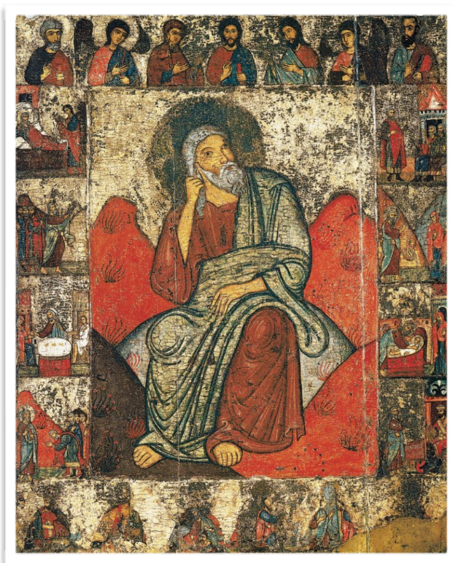
Icône russe du XIIe siècle

Élie est apparu dans la Bible deux chapitres plus tôt. Il n'y a plus de pluie ni de rosée, c'est un temps de sécheresse et de famine. Il trouve refuge au bord d'un torrent, puis chez une veuve et son fils qui habitent Sarepta au Liban. Là viendra un signe du Seigneur qui leur sauvera la vie à tous les trois. Jamais la farine et l'huile ne manquèrent dans cette maison jusqu'au temps où viendra la pluie.