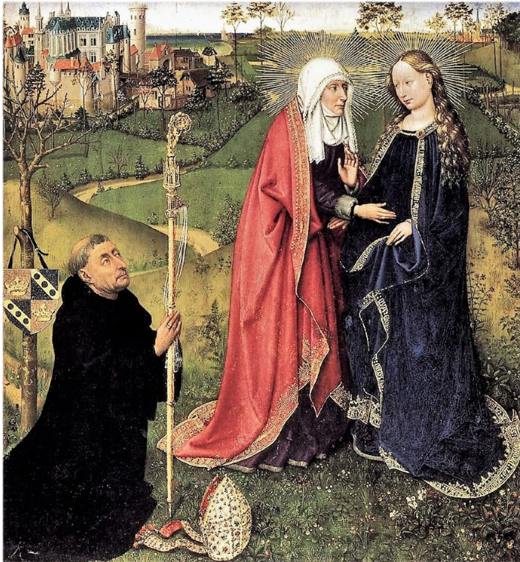
Jacques Daret La visitation avec un donateur France, 1434-1435

En ces jours-là, Marie se mit en route et se rendit avec empressement vers la région montagneuse, dans une ville de Judée. Elle entra dans la maison de Zacharie et salua Élisabeth. Or, quand Élisabeth entendit la salutation de Marie, l'enfant tressaillit en elle.