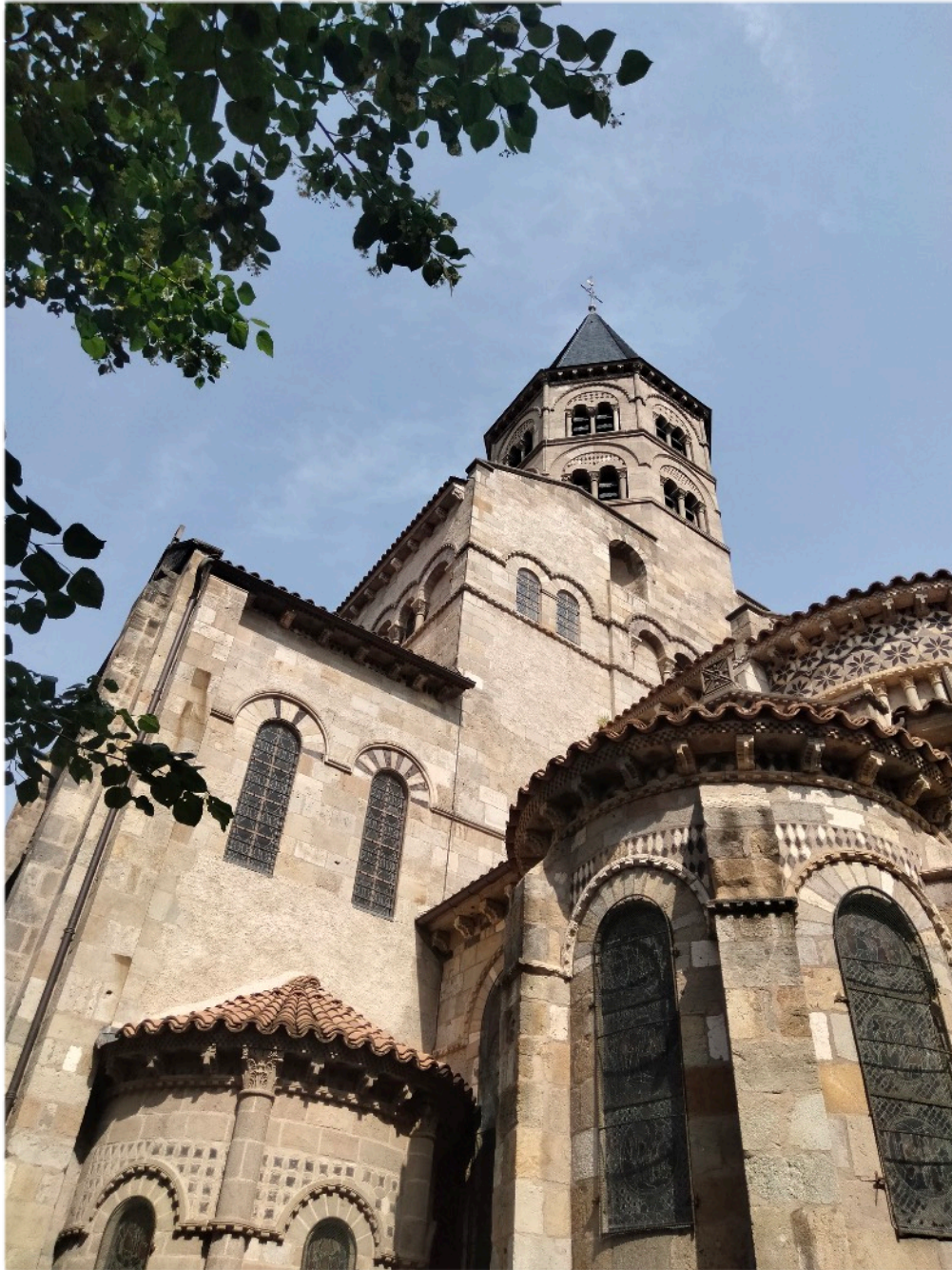
Notre-Dame du Port - Clermont-Ferrand.