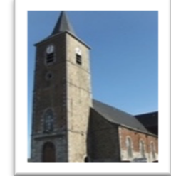
NOTRE DAME D'AYDE