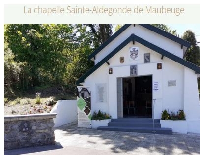
La chapelle Sainte-Aldegonde de Maubeuge

Coût : 10 €/pèlerin (gratuit pour les enfants de moins de 12 ans)