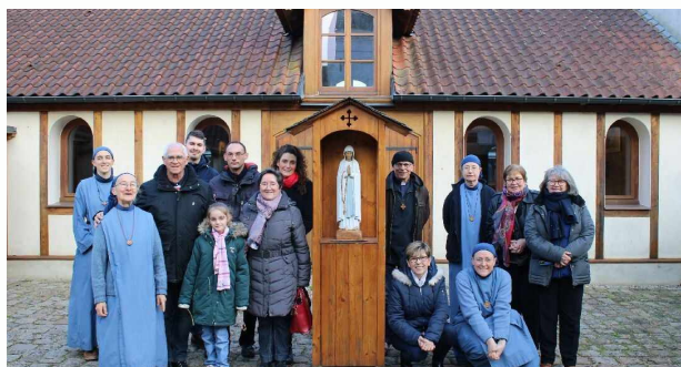
Sortie équipe EAP chez les Petites Sœurs de Béthune le 07 mars