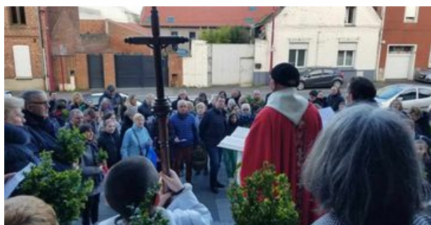
Messe des Rameaux Auberchicourt le 23 mars