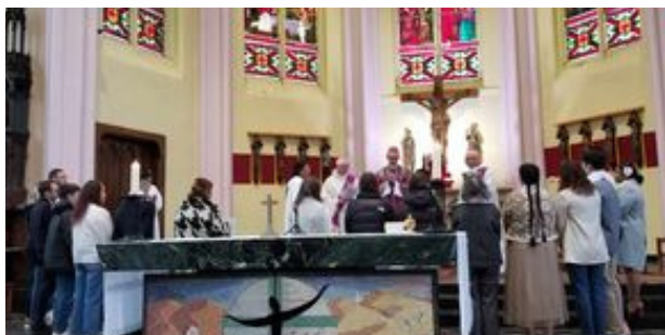
Confirmations Eglise d'Aniche le 03 mars