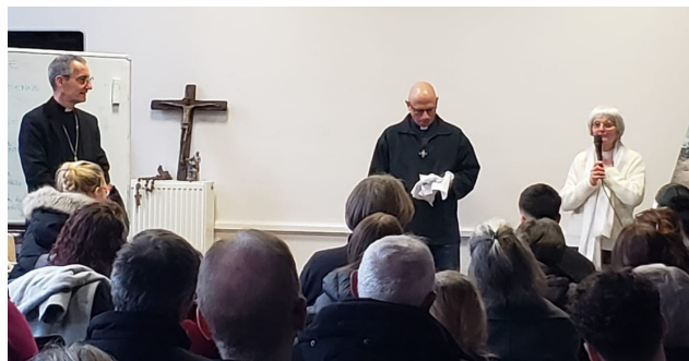
Témoignage de la 70ème Miraculée de Lourdes Sœur Bernadette le 03 mars