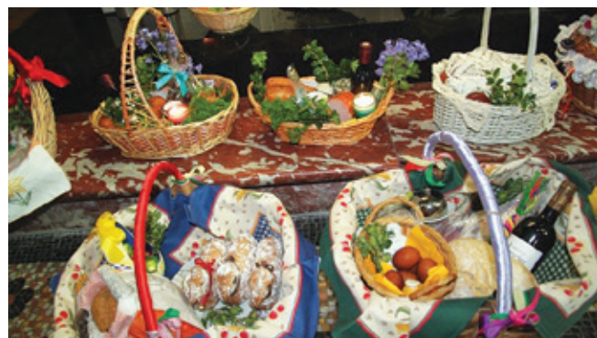
Les paniers de 2022.