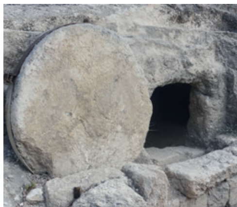
Tombeau découvert sur la route vers Jérusalem.

Jésus a été déposé dans un tombeau et celui-ci est vide... Où l'a-t-on déplacé ? Une rumeur court : « Il est vivant ! » Des femmes l'ont vu, il est apparu aux Apôtres, mais pas à Thomas, l'un des leurs. « Si je ne le vois pas, je n'y croirai pas. » Il nous ressemble souvent, lui qu'on surnomme aussi le jumeau. Juste avant de disparaître à ses yeux, Thomas a pu toucher Jésus et s'entendre dire : « Heureux ceux qui croient sans avoir vu. » Nous ne verrons plus Jésus marcher dans nos villes comme il marchait en Galilée... Mais sa présence est devenue toute autre, et n'est pas moins réelle. Christ rassemble encore et ouvre une espérance folle. Regardez, il y en a qui voient ce qu'ils croient !