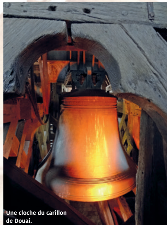
Une cloche du carillon de Douai.

Rome en quête d'une bonne nouvelle ou d'une bénédiction papale. Non, elles feront silence devant la mort. Mais dès qu'elles découvriront que la vie est plus forte, que Jésus est ressuscité, alors là, préparez-vous à les entendre chanter leur joie ! Elles ne pourront plus se retenir ! Il y en a même qui affirmeront qu'elles ramènent des œufs en abondance... Merci les cloches !