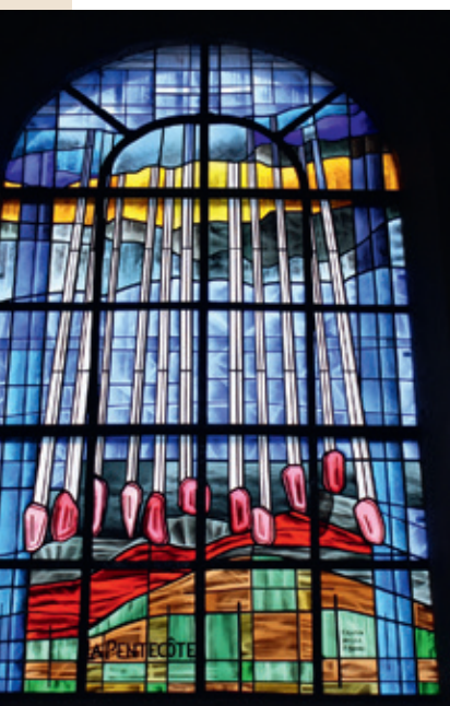
L'Esprit saint comme des langues de feu.