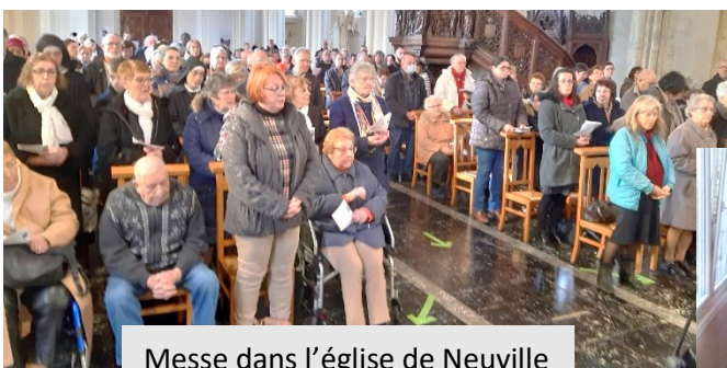
Messe dans l'église de Neuville