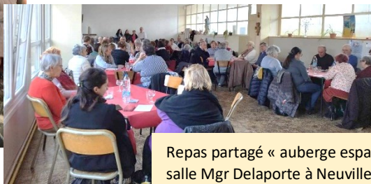
Repas partagé « auberge espagnole » salle Mgr Delaporte à Neuville