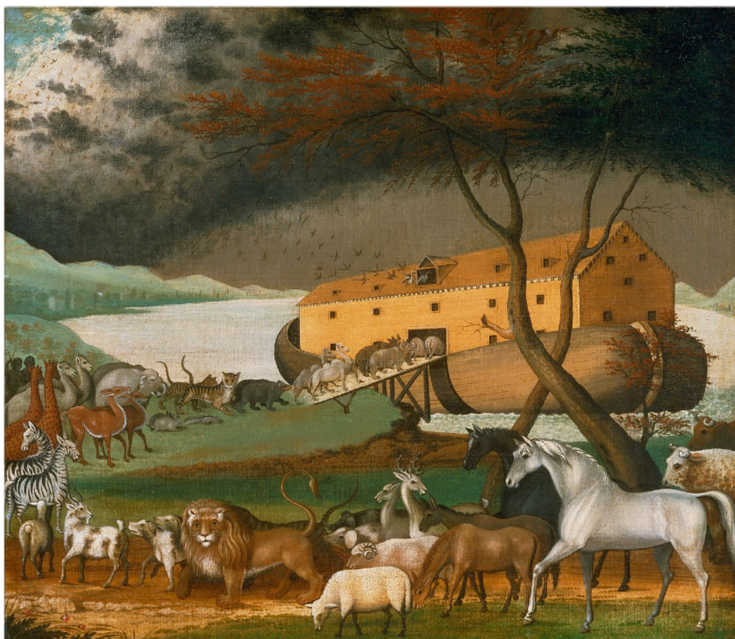
L'Arche de Noé. Tableau d'Edward Hicks (1846)

La Bible reprend et réinvente ici une très vieille histoire de déluge entendue du côté de Babylone. Comme dans l'évangile des quarante jours au désert, il y est question de tentation. Sauf qu'ici dans la Genèse, ce n'est pas Jésus qui affronte le mal ; c'est l'humanité, la création toute entière qui entre en tentation. Le Seigneur vit que la méchanceté de l'homme était grande sur la terre, et que toutes les pensées de son cœur se portaient uniquement vers le mal à longueur de journée.