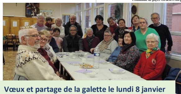
Vœux et partage de la galette le lundi 8 janvier