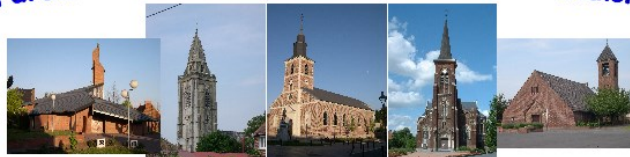
Abscon Escaudain Lourches Neuville Roeux

Seigneur, Tu veux pour moi la Vie, Toujours plus de Vie avec toi, Mais ma vie, à certaines heures est tellement complexe... Que me dis-tu ? A quoi Seigneur m'invites-tu ?