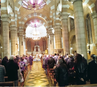
Mortagne - Ste Odile