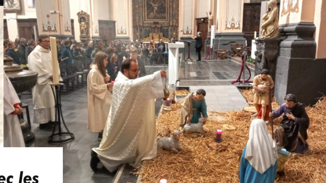
Saint Martin - St Amand