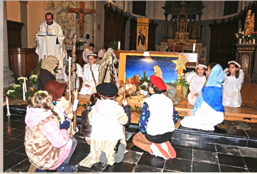
Lecelles - St Eloi