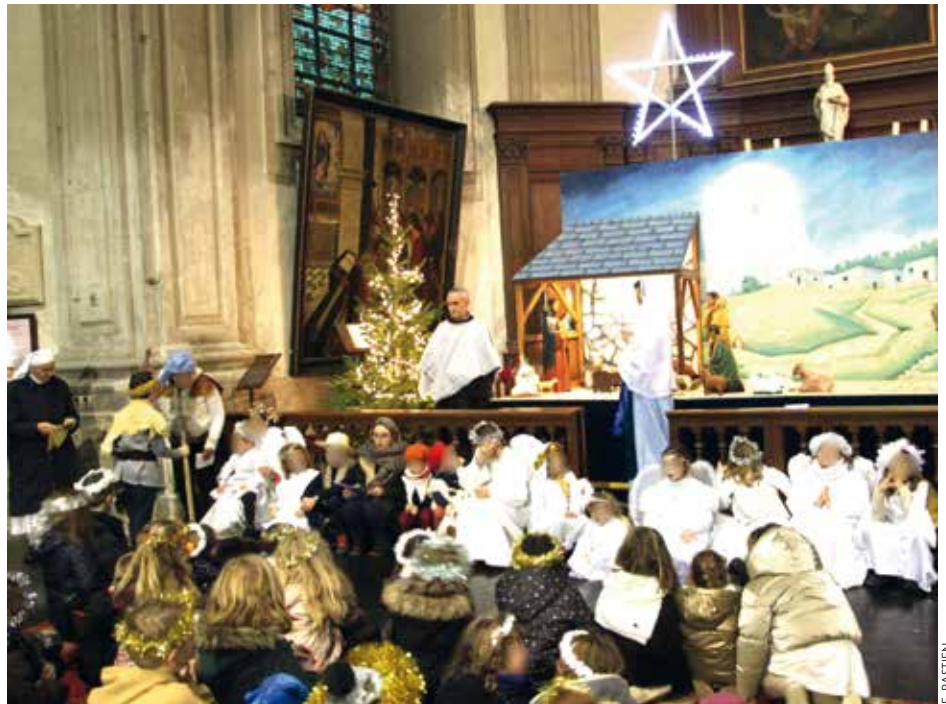
C'était le Noël des petits en 2022.