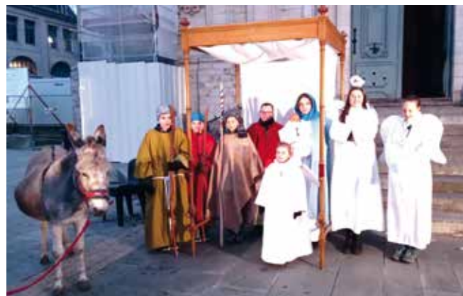
La crèche 2022.

Et si le parvis de la cathédrale prenait vie pour Noël ! Imaginez, par le truchement des servants d'autel, les marches du parvis vont se transformer en crèche joyeuse et vivante. Marie, Joseph et les bergers seront bien présents, de chair et d'os.