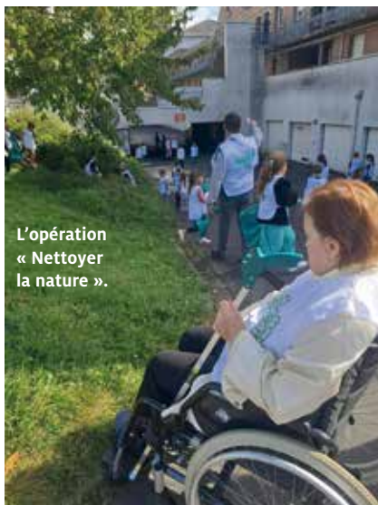
L'opération « Nettoyer la nature ».

Il y a aussi des occasions de rencontres : la messe avec l'abbé et quelques paroissiens, l'atelier d'équithérapie (des chevaux nains viennent se faire caresser dans les chambres), les activités avec les enfants de l'école primaire pour l'opération « Nettoyons la nature » durant