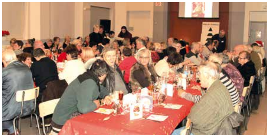
Noël œcuménique 2022.