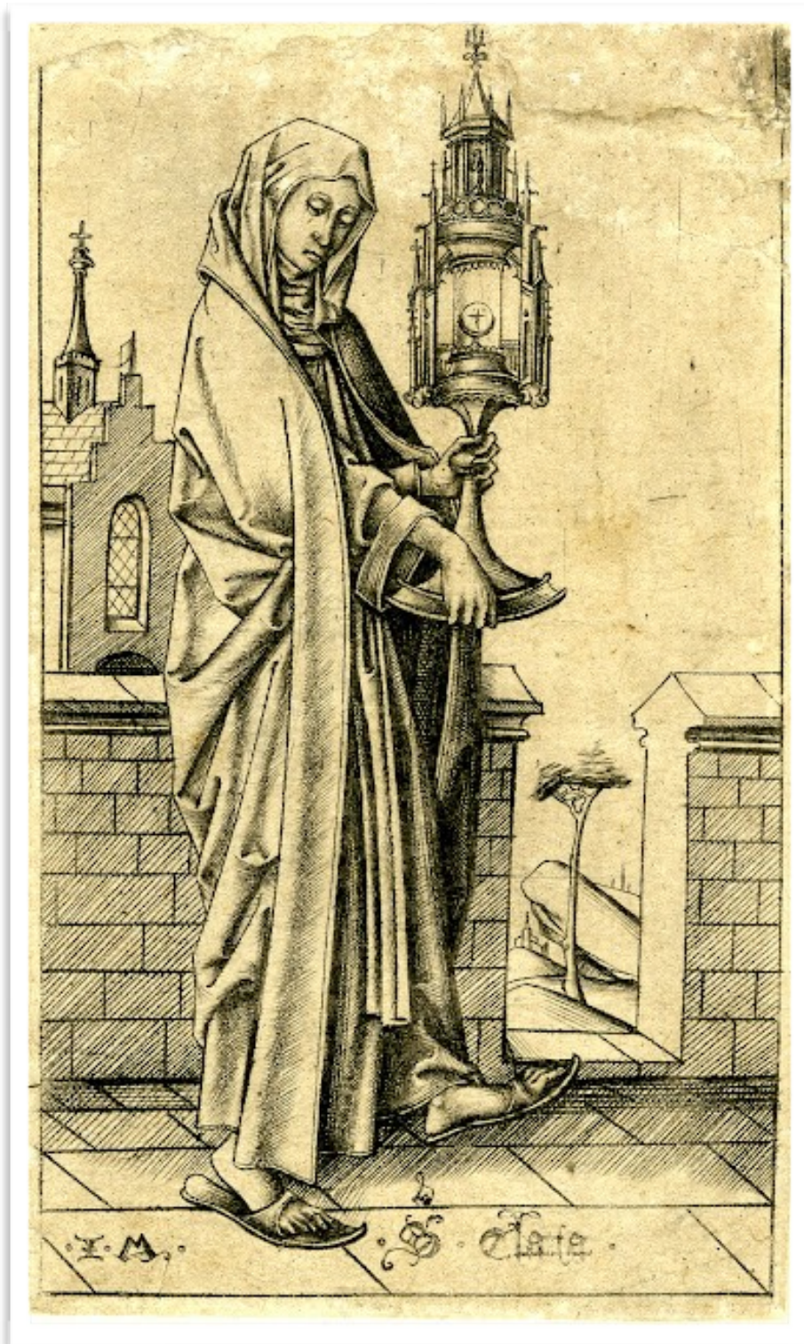
Israbel van Meckenem, Saint Claire Allemagne, vers 1465-1475 Londres, British Museum