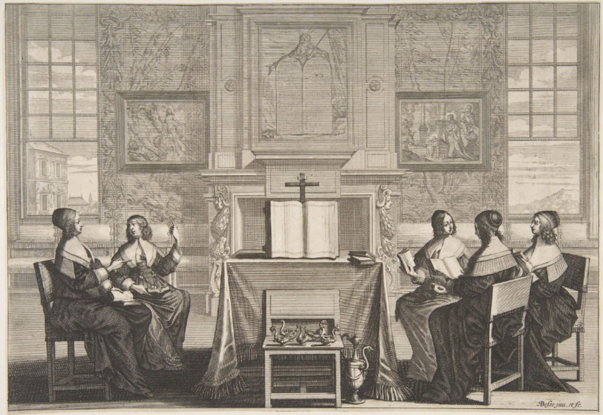
La conversation des vierges folles et des vierges sages, Abraham Bosse, 1635