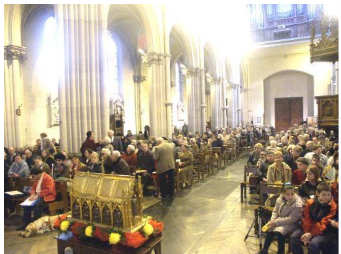
Ici l'aveugle est assis dans la basilique en compagnie de son chien guide : un labrador blond