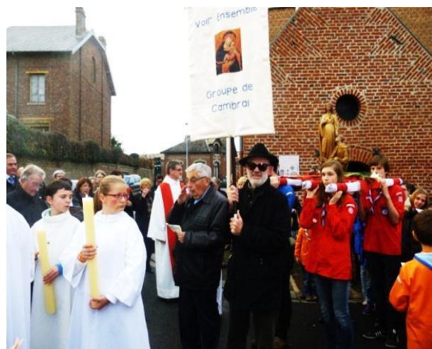
Le groupe « voir ensemble » à la chapelle